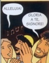
TRA LA FOLLA, ATTIRATA DAL RUMORE, CI SONO MOLTI STRANIERI. EPPURE, OGNUNO SENTE PARLARE DELLE MERAVIGLIE DI DIO NELLA SUA LINGUA...