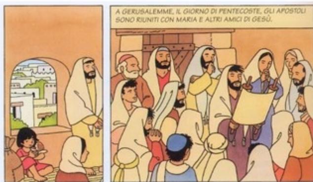
A GERUSALEMME, IL GIORNO DI PENTECOSTE, GLI APOSTOLI SONO RIUNITI CON MARIA E ALTRI AMICI DI GESÙ.