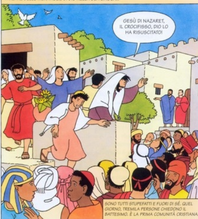
SONO TUTTI STUPEFATTI E FUORI DI SÉ. QUEL GIORNO, TREMILA PERSONE CHIEDONO IL BATTESIMO. È LA PRIMA COMUNITÀ CRISTIANA.